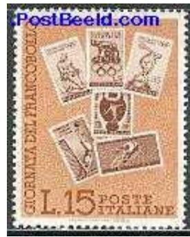
1960-Italy n° 812 -339-816-818-870-894 euro 0,30 SOS-1964-Italy Y&T 915 Giornata del Francobollo