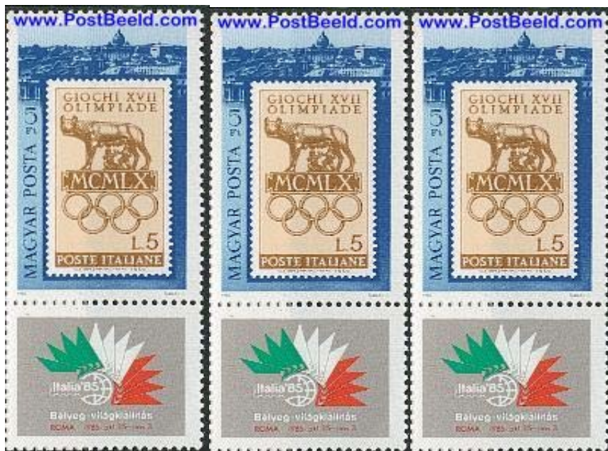
1960-Italy n° 812 euro 0,15 SOS-1985-Hungary Y&T BF Italia '85