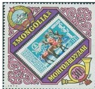
1924-Mongolia N° 197 euro 0,30 SOS-1973-Mongolia Y&T n° A 43 conferenza Postale