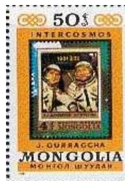
1981-Mongolia N° B75 euro 6,00 SOS-1981-Mongolia Y&T n° B83 Cosmonauti