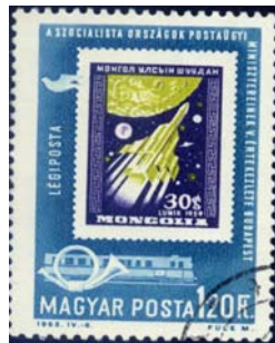
1959-Mongolia N° 157 euro 0,50 SOS-1963-Hungary Y&T n° A265 e ND Budapest '63

Repubblica nell'Asia Centrale tra la Cina e la Siberia. Dal 1689 la regione fu sotto controllo Cinese. Nel 1911, la Mongolia dichiarò la sua indipendenza. Nel 1924 fu occupata dall'Unione Sovietica, e nel 1945, dopo che la Cina rinunziò alle sue pretese territoriali, fu ristabilita la Repubblica.